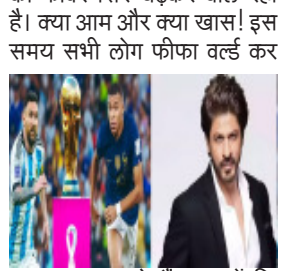
का मजा उठा रहे हैं। बता दें कि बॉलीवुड के कई सेलेब्स कतर जाकर स्टेडियम में फीफा वर्ल्ड का लुपुत उठा चुके हैं। बॉलीवुड की बात हो

(आधुनिक समाचार सेवा) का फीवर सिर चढ़कर बोल रहा है। क्या आम और क्या खास! इस समय सभी लोग फीफा वर्ल्ड कप का फाइनल मुकाबला 18 दिसंबर को खेला जाएगा। पहले सेमीफाइनल में अर्जेंटीना ने 3-0 से क्रोएशिया को हराकर फाइनल में जगह बना ली तो दूसरे सेमीफाइनल में फ्रांस ने मोरक्को को 2-0 से हराकर फाइनल में इटली मार ली। 5 गोल के साथ एम्बापे और मेसी इस विश्वकप में सर्वाधिक गोल की दौड़ में सबसे आगे हैं। 18 दिसंबर को लुसेल स्टेडियम में फीफा विश्वकप का फाइनल होगा। भारत में फीफा