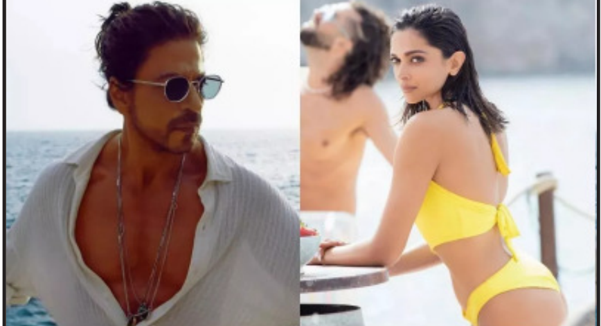
सकारात्मक रहेंगे। इसके पहले उन्होंने कहा था, 'सोशल मीडिया पर मतों का दायरा काफी संकरा होता है। वह मानवीय स्वभाव को लिमिट करने का प्रयास करता है। मैंने कभी पढ़ा है कि सोशल मीडिया के उपयोग से नेगेटिविटी बढ़ती है। इसके चलते भेदभाव और बांटने की प्रवृत्ति में भी बढ़ोतरी होती है। गौरतलब है कि शाह रुख खान के अलावा अमिताभ बच्चन और

उन्होंने रविंद्रनाथ टैगोर को भी कोट किया। अमिताभ बच्चन इस अवसर पर ब्लू सूट पहने नजर आए। कोलकाता इंटरनेशनल फिल्म फेस्टिवल 15 से 22 दिसंबर को कोलकाता में आयोजित हो रहा है। शाह रुख खान कोलकाता नाइट राइडर्स आईपीएल टीम के भी मालिक हैं। वह जल्द फिल्म पठान में