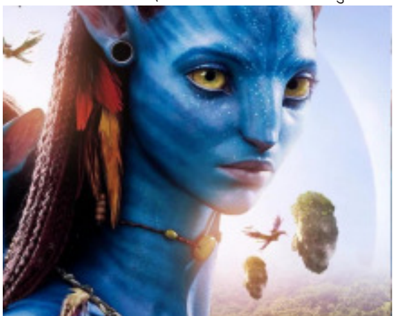
दूसरा पार्ट आ रहा है। इस साई-फाई फिल्म की रिलीज से पहले ही इसका बज बन चुका है और फिल्म की एडवांस बुकिंग की काफी अच्छी है। लेकिन आपको शायद ये नहीं पता होगा कि इतने ग्रैंड स्कैल फिल्म बनाने के आइडिया जेम्स कैमरून को एक सपने से आया था। ये सपना किसी और ने नहीं, बल्कि उनकी मां ने देखा था। उनकी मां ने अपने सपने में जो भी देखा उस से निर्देशक को कह चुना था, जिसे

किया गया। दर्शकों को अवतार: द वे ऑफ वाटर का बेसवरी से इंतजार है। मीडिया रिपोटर्स की मानें तो इस साई-फाई हॉलीवुड फिल्म की गुरुवार तक पांच लाख से अधिक टिकटें बिक चुकी हैं और लगातार सोल्ड हो रही हैं। फिल्म की एडवांस बुकिंग को देखते हुए यह अनुमान लगाया जा रहा है कि ये फिल्म दुनियाभर में 52000 से ज्यादा स्क्रीन्स के साथ वीकेंड पर ही 150 मिलियन से 175 मिलियन डॉलर तक की कमाई कर सकती है।