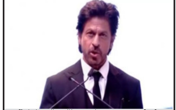
मुखर्जी को टोल करें। उन्होंने यह भी कहा कि अगर दर्शकों को उनकी बंगाली पसंद आई तो शाबाशी उन्हें मिलनी चाहिए। शाह रुख खान ने इस कार्यक्रम में फिल्म पठान के गाने बेशरम रंग पर हुए बवाल को भी प्रतिक्रिया दी है। उन्होंने कहा, 'चाहे कुछ भी हो

जाए लेकिन मैं पॉजिटिव बना रहूंगा। शाहरुख खान ने इस अवसर पर दर्शकों से बात करते हुए बंगाली में स्पीच भी दी। शाह रुख खान कोलकाता इंटरनेशनल फिल्म फेस्टिवल 2022 का शुभारंभ करने पहुंचे थे। यह कार्यक्रम 15 दिसंबर से 22 दिसंबर तक चलने वाला है। इसमें उनके अलावा अमिताभ बच्चन, जया बच्चन और सौरव गांगुली भी मौजूद