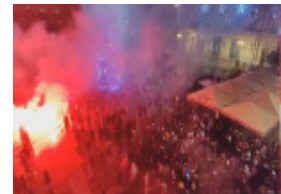
सेमीफाइनल में मिली हार के बाद मोरक्को के समर्थक भड़क गए। हार के मोरक्को के समर्थकों ने जमकर प्रदर्शन करते हुए तैलफेंड की। बुधवार रात त्यों में दंगे भड़क उठे। वहीं फ्रांस

की जीत का जश्न माने के दौरान एक बच्चे की सड़क दुर्घटना में मौत हो गई। बता दें कि 1912 से 1956 तक मोरक्को फ्रांसीसियों का गुलाम रहा है। फीफा विश्व कप में उलटफेर करते हुए मोरक्को सेमीफाइनल में पहुंचा था। ऐसे में दर्शकों को उम्मीद थी कि वह फ्रांस को हराकर फाइनल में पहुंचेगा, लेकिन ऐसा नहीं हुआ। फ्रांस में भड़के दंगे को पुलिस ने बड़ी मुश्किल से शांत कराया। औपनिवेशिक अतीत होने के चलते फ्रांस में बड़ी संख्या में मोरक्को के प्रवासी रहते हैं। उत्तरी अफ्रीकी देश की करीब 38 मिलियन की आबादी की कुलना में, लगभग 5 मिलियन मोरक्को ने फ्रांस को अपना घर बना लिया है।