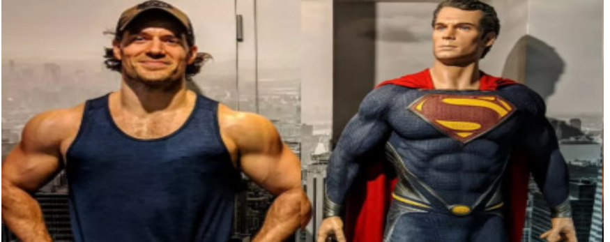
कहा हुआ, 'वैसा कोई दूसरा नहीं जुड़ सका। आज भी मैन ऑफ स्टील के लिए उन्हें ही याद किया जाता है, मगर हेनरी के फैंस को यह जानकर झटका लग सकता है कि वो सुपरमैन के किरदार में अब नहीं लौटेंगे। यह झटका खुद हेनरी ने सोशल मीडिया पोस्ट के जरिए दिया, जिसके बाद उनके फैंस सकते

करता हूँ जेम्स एंड पीटर को एक यूनिवर्स बनाया है। मैं उन्हें और इस नये यूनिवर्स की तैयारियों से जुड़े सभी लोगों को शुभकामनाएं देता हूँ। वो सभी, जो इतने सालों में मेरे साथ खड़े रहे, हम थोड़ा दुख जता सकते हैं, लेकिन हमें यह भी याद रखना चाहिए, सुपरमैन अभी भी है। वो जिसके लिए खड़ा होता है, वो अभी भी है और उसने जो मिसालें कायम की हैं, वो अभी भी हैं। लंबाया पहनने का मेरा वक्त चला गया, लेकिन जिस चीज के लिए सुपरमैन खड़ा होता है।