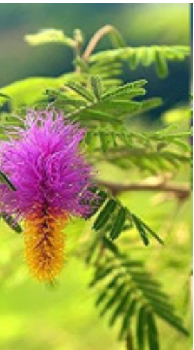
तेजस्विता एवं दृढ़ता का प्रतीक है। इसमें प्राकृतिक तौर पर अग्निवृत्त की प्रचुरता होती है इसलिए इसे यज्ञ में अग्नि को प्रज्वलित करने