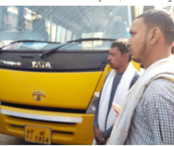
संचालन बेरोकटोक जारी होने से आए दिन हादसे होते रहते हैं। जानकारी के अनुसार महात्मा गांधी काशी विद्यापीठ परिसर में संचालित आशा महाविद्यालय की बस (यूपी 65 ईटी5934) कर्मचारियों को छोड़कर निकल रही थी। प्रत्यक्षदर्शियों की माने तो गली में ही बाई तरफ अचानक एक अथेड

बस के पिछले पहिए के नीचे आ गया। चीख पुकार सुनकर दौड़े स्थानीय लोगों ने बस को रोक