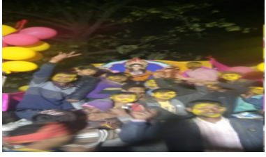
बैराजपुर स्थित वरुणा नदी में मूर्ति विसर्जन हुआ। वही ग्रामीण क्षेत्र के दर्जनों गांवों के युवाओं ने सोमवार देर शाम को मां सरस्वती के प्रतिमा

का वरुणा नदी में विसर्जन किया। हरहुआ बाजार, कोईराजपुर, वाजिदपुर, भगतपुर, नैयपुरा धनेश्वरी औसानपुर, मानसापुर, चमाव, इत्यादि कई गांवों में बसन्त पंचमी पर मां सरस्वती पूजा के बाद ग्रामीण युवाओं ने डीजे पर नाचते गाते व रंग अबीर खेलते साथ में महिलाओं व, पुरुषों व, बच्चे, नौजवान अमीर गुलाल उड़ाते हुये वरुणा नदी तट कोईराजपुर में पहुंचकर प्रतिमा का विसर्जन किया।