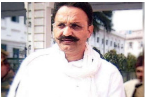
बनाने आदि को लेकर जिला प्रशासन और पुलिस ने समर्थकों व सहयोग करने वालों पर विशेष नजर रखनी शुरू कर दी है। वहीं,

वाराणसी। मऊ जिले के सदर विधानसभा क्षेत्र से मुख्तार अंसारी के चुनाव लड़ की सुगबुगाहट पर ही शासन-प्रशासन अलर्ट हो गया है। चुनाव में धांधली, पक्ष में मतदान कराने के लिए मतदाताओं पर दबाव