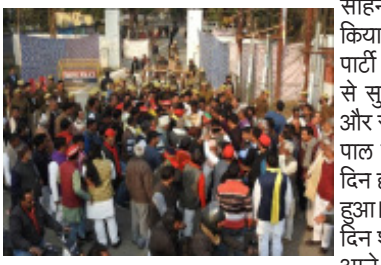
दलगत और निर्दलीय उम्मीदवार अपना नामांकन कर रहे हैं। नामांकन को लेकर दिन भर पुलिस अलर्ट मोड में रही है। कलेक्ट्रेट के