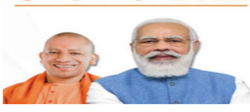
एक्सप्रेस वे की सौगात देने की बात कही गई है। पार्टी की ओर से इस बाबत संदेश जारी होने के बाद पार्टी पदाधिकारियों की ओर से इस बाबत संकल्प पत्र को साझा कर भाजपा सरकार आने पर प्रमुखता से इन परियोजनाओं को पूरा करने की बात कही गई है। सोलह पन्नों की इस रिपोर्ट में पूर्वांचल के लिहाज से प्रमुख योजनाओं को धरातल देने के लिए पहल की बात कही गई है। लोककल्याण संकल्प पत्र 2022 के जरिए भाजपा ने यूपी फिर मांगे