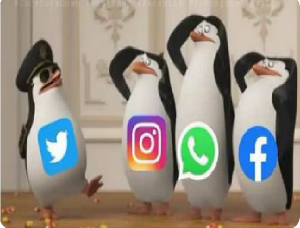
कोई भी बना सकता है और ये किसी भी चीज के बारे में हो सकते हैं-वर्तमान घटनाओं से लेकर किन्हीं

जितने लंबे भी। कुछ मीम की लोकप्रियता क्षणिक होती है, जबकि कुछ वर्षों तक टिके रहते हैं। मीम की अवधारणा की जड़ें जीवविज्ञानी रिचर्ड डॉकिन्स की 1976 में प्रकाशित किताब दे सेलिफ़श जीन