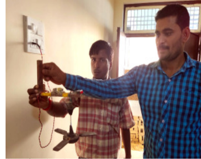
नैनी आईटीसी के छात्रों द्वारा बनाया गया मॉडल।