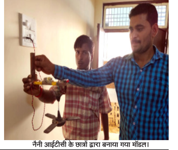
नैनी आईटीसी के छात्रों द्वारा बनाया गया मॉडल।