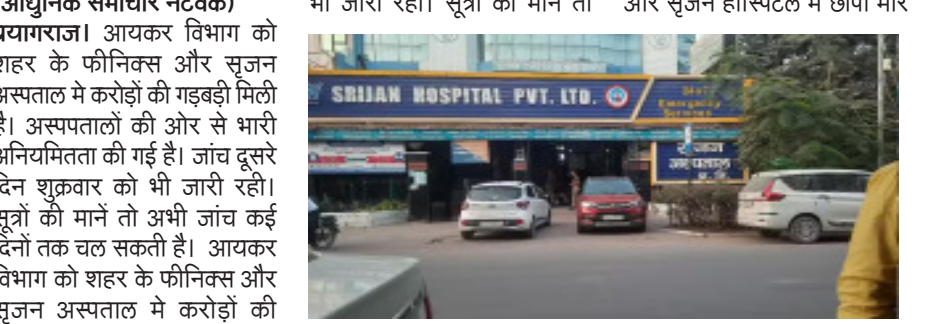
भी जारी रही। सूत्रों की मानें तो और सृजन हॉस्पिटल में छापा मार

(आधुनिक समाचार नेटवर्क) प्रयागराज। आयकर विभाग को शहर के फीनिक्स और सृजन अस्पताल में करोड़ों की गड़बड़ी मिली है। अस्पतालों की ओर से भारी अनियमितता की गई है। जांच दूसरे दिन शुक्रवार को भी जारी रही। सूत्रों को मानें तो अभी जांच कई दिनों तक चल सकती है। आयकर विभाग को शहर के फीनिक्स और सृजन अस्पताल में करोड़ों की गड़बड़ी मिली है। अस्पतालों की ओर से भारी अनियमितता की गई है। जांच दूसरे दिन शुक्रवार को भी जारी रही। सूत्रों को मानें तो अभी जांच कई दिनों तक चल सकती है। आयकर विभाग की टीम ने बृहस्पतिवार को फीनिक्स और सृजन हॉस्पिटल में छापा मार दिया था। टीम ने अस्पतालों में हिस्सेदार व इलाहाबाद मेडिकल एसोसिएशन (एमएम) के अध्यक्ष