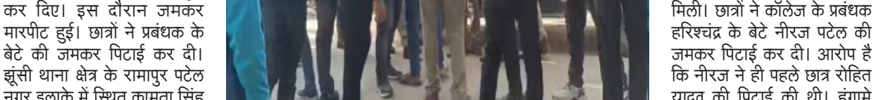
कॉलेज के लोगों ने छात्रों के साथ अश्रुदाता की। इसको लेकर छात्रों ने बड़ी संख्या में छात्र परीक्षा देने के लिए पहुंचे थे। छात्रों का आरोप है कि परीक्षा कक्ष में जाने से पहले छात्रों की तलाशी ली जा रही थी। विवाद उस समय बढ़ गया जब तलाशी ले रहे कॉलेज स्टाफ के शिक्षक और अन्य कर्मचारियों ने परीक्षार्थियों के कपड़े उतरवाने

(आधुनिक समाचार नेटवर्क) प्रयागराज। कामता सिंह पीजी कॉलेज में शुक्रवार को एलएलबी की परीक्षा आयोजित की गई थी। बड़ी संख्या में छात्र परीक्षा देने के लिए पहुंचे थे। छात्रों का आरोप है कि परीक्षा कक्ष में जाने से पहले छात्रों की तलाशी ली जा रही थी। विवाद उस समय बढ़ गया जब तलाशी ले रहे कॉलेज स्टाफ के शिक्षक और अन्य कर्मचारियों ने परीक्षार्थियों के कपड़े उतरवाने शुरू कर दिए। इस दौरान जमकर मारपीट हुई। छात्रों ने प्रबंधक के बेटे की जमकर पिटाई कर दी। झूसी थाना क्षेत्र के रामपुर पटेल नगर इलाके में स्थित कामता सिंह पीजी कॉलेज में छात्रों ने जमकर बवाल किया। एलएलबी के छात्रों का आरोप है कि परीक्षा कक्ष में जाने से पहले परीक्षार्थियों के कपड़े उतरवाकर चेकिंग की गई। इसका तमाम छात्रों ने विरोध किया तो