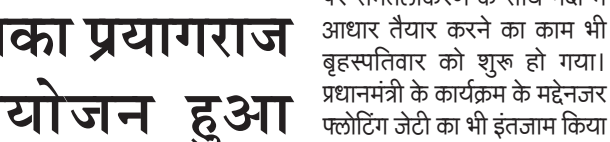
को प्रयागराज आ रहे हैं। विशेष

(आधुनिक समाचार नेटवर्क) प्रयागराज। प्रधानमंत्री 13 दिसंबर को प्रयागराज आ रहे हैं। विशेष यान से बमरौली एयरपोर्ट पर आएंगे। प्रधानमंत्री वहां से अरैल हेलिकॉप्टर से आएंगे। इसके बाद निषादराज कूज से वह संगम भ्रमण करेंगे। इसी क्रम में प्रधानमंत्री गंगा पूजन कर महाकुंभ-2025 की शुरुआत करेंगे। प्रधानमंत्री नरेंद्र मोदी गंगा पूजन कर महाकुंभ की शुरुआत करेंगे। इसके लिए जेटी तैयार होने लगी है। संगम नोज पर समतलीकरण के साथ नदी में आधार तैयार करने का काम भी बृहस्पतिवार को शुरू हो गया। प्रधानमंत्री के कार्यक्रम के मद्देनजर फ्लोटिंग जेटी का भी इंतजाम किया गया है। प्रधानमंत्री के कार्यक्रम के मद्देनजर जेटी एवं पंडाल समेत संगम का बड़ा इलाका तीन दिन पहले ही एस्पोजी की सुरक्षा घेरे में आ जाएगा। निर्धारित दूरी तक आवागमन भी प्रतिबंधित रहेगा।