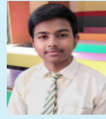
अनुशासन और सकारात्मक सोच से हर लक्ष्य को प्राप्त किया जा सकता है। इस अवसर पर

प्रयास का परिणाम है। उन्होंने कहा कि कठिन परिश्रम,