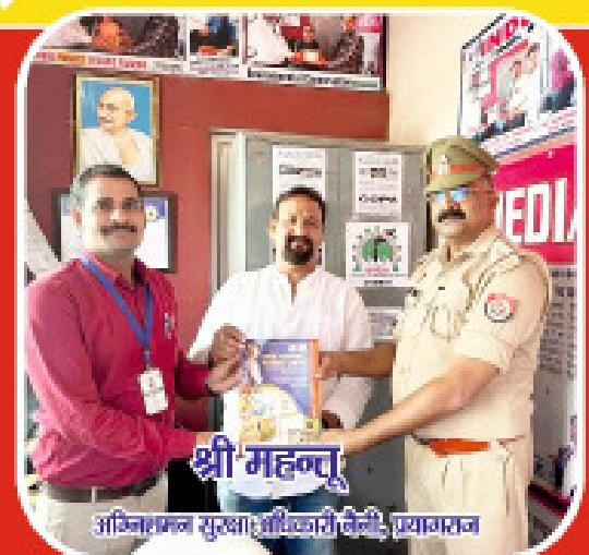
श्री महन्त, अग्निप्रमल सुरक्षा अधिकारी, प्रयागराज