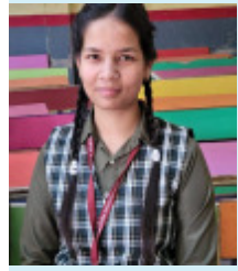
अनुशासन की मिसाल बने माँ वैष्णो मॉडर्न एमवीएम पब्लिक स्कूल, रॉडर्सगंज के विद्यार्थियों ने

(आधुनिक समाचार नेटवर्क) सोनभद्र। मेहनत, लगन और