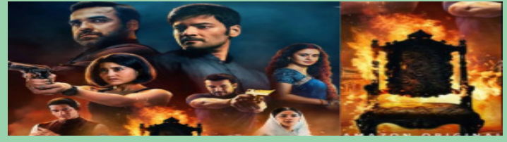
कालीन भैया' की गद्दी छीन लेगा ये गैंगस्ट यूजर्स ने बताया किसने मचाया भौकाल