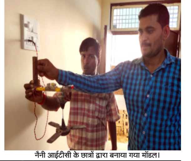
नैनी आईटीसी के छात्रों द्वारा बनाया गया मॉडल।