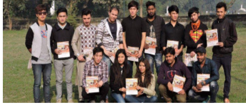
अन्तर्राष्ट्रीय छात्र समूह