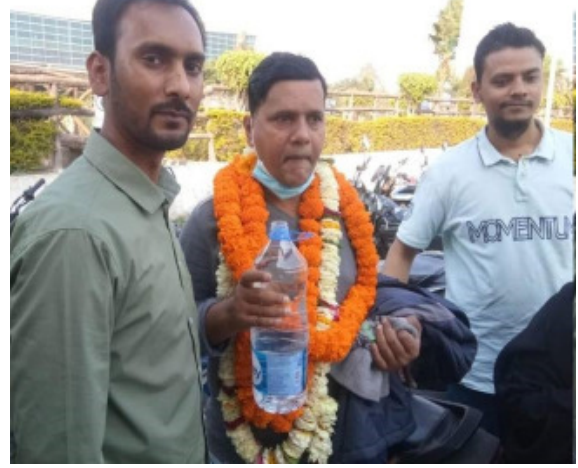
लिए रवाना किया। विमान गुरुवार की सुबह सात बजे छत्रपति शिवाजी अंतरराष्ट्रीय हवाईअड्डा मुंबई पर उतरा। वहां से दोपहर बाद वाराणसी के लिए विमान से रवाना होकर शाम 3 बजे बाबतपुर सकुशल पहुंच गए। एयरपोर्ट पर ब्रेसट्रो से इंतजार कर रहे स्वजन को देखते ही उनकी आंखें छलक उठीं। भाई, भतीजे, भांजे और खासकर बहनों की भरी हुई आंख से आंख मिलते

ही उनके मुंह से शुकिया मोदी जी और भारत सरकार के बोल निकल पड़े। वाराणसी के थाना आदमपुर क्षेत्र के पठानी टोला के मूल निवासी