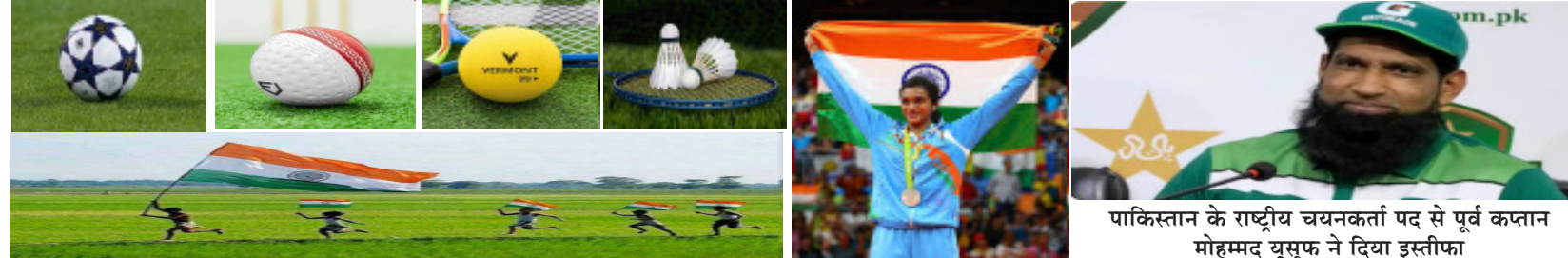
पाकिस्तान के राष्ट्रीय चयनकर्ता पद से पूर्व कप्तान मोहम्मद यूसुफ ने दिया इस्तीफा