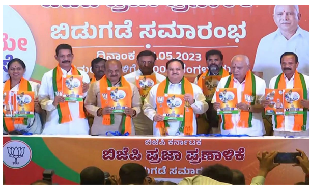
ये हैं संकल्प पत्र की प्रमुख बातें: - कर्नाटक में बीजेपी की सरकार बनने पर यूनिफॉर्म सिविल कोड लागू होगा - प्रदेश के हर वर्ग में अटल आहार केंद्र स्थापित किया जाएगा - बीपीएल परिवारों को तीन सिलेंडर निशुल्क उपलब्ध कराए जाएंगे - बीपीएल परिवारों को सरकार आधा लीटर नदिनी दूध मुफ्त में मुहैया कराएगी - किसानों को बीज के लिए दस हजार रुपये दिए जाएंगे - गरीब परिवारों को पांच किलो चावल और 5 किलो मोटा अनाज मुहैया कराया जाएगा।