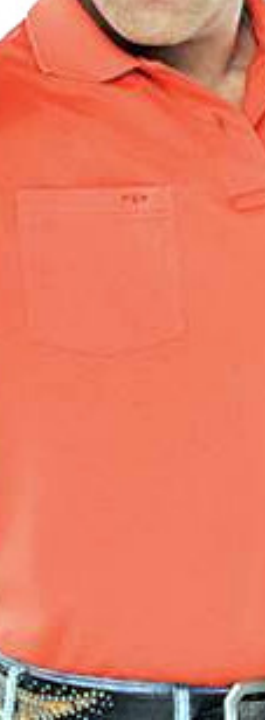
लॉरेंस सता रहा हरकत कर सलमान खान पहुंचे। अभिनेता और उन्हें घेर लिया। अपने सुरक्षा और अंगरक्षक शेरों से घिरे होने के बावजूद, उनके प्रशासकों ने तस्वीरों और हाथ मिलाने के लिए अभिनेता तक पहुंचने की कोशिश की। एक प्रशासक द्वारा की गई ऐसी ही एक कोशिश से लगता है कि अभिनेता नाराज हो गये। हवाई अड्डे पर एक लगातार प्रशासक जिसने जल्दी से हाथ मिलाने की उम्मीद में सलमान के पास जाने की कोशिश की, उसने अपना हाथ बढ़ाया लेकिन अभिनेता और उसके अंगरक्षक ने उसे पीछे धक्का दे दिया। वीडियो में दिखाया गया है कि बजरंजी भाईजान गुस्से में कुछ बुदबुदाते हुए नजर आये। सलमान खान आखिरी बार किसी का भाई किसी की जान में नजर आए थे। इसमें पूजा हेडगा, शहनज गिल, राघव जुयाल, सिद्धार्थ निगम, वैकटेश और अन्य ने भी अभिनय किया। यंतमाम में राम चरण की विशेष भूमिका है। यह फिल्म 21 अप्रैल, 2023 को सिनेमाघरों में रिलीज हुई। यह फरहाद सामजी द्वारा निर्देशित और सलमान खान फिल्म्स द्वारा निर्मित है।