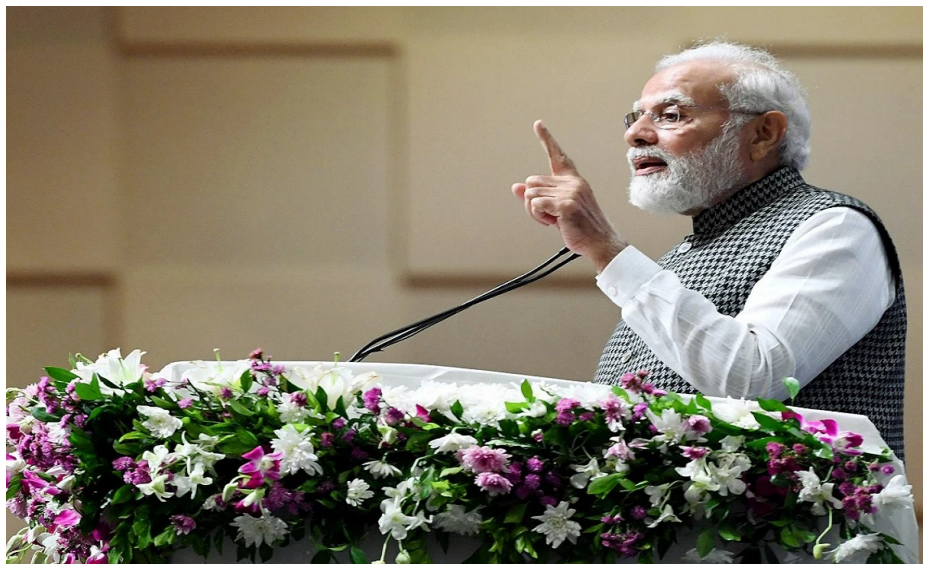
प्रत्येक वोट सिधे कांग्रेस को जाएगा और इससे कर्नाटक में अस्थिरता आएगी। उन्होंने कहा, "जब कांग्रेस और जद(एस) सत्ता में आएगी, कुछ परिवारों को फायदा होगा लेकिन भाजपा के लिए भारत और कर्नाटक का प्रत्येक परिवार पार्टी का अपना परिवार है।"

यहां 2.5 लाख परिवारों का बीमा किया गया, 50,000 लोग अटल पेंशन योजना के पात्र बने और 7,000 पक्के मकानों को मंजूरी दी गई।" मोदी ने आरोप लगाया, "कांग्रेस विश्वासघात की पर्याय है। इसने किसानों को धोखा दिया। कांग्रेस अपनी ऊर्जा एक ऐसी प्रणाली बनाने में लगाती है जो