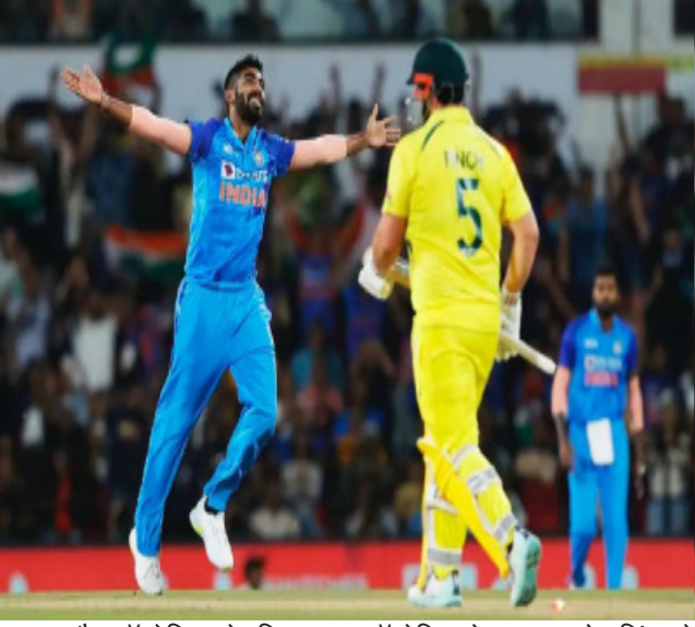
भारत और ऑस्ट्रेलिया के खिलाफ ऑस्ट्रेलिया के कप्तान एरोन फिच को

एक शानदार यॉर्कर गेंद पर आउट कर दिए। इस गेंद ने फिच को पूरी तरह से हैरान कर दिया था। आउट होने के तुरंत बाद फिच ने बुमराह की तारीफ करते हुए ताली बजाई। यह देखकर कई क्रिकेट फैंस भी हैरान रह गए। बता दें कि इस मैच में फिच ने 15 गेंदों पर 4 चौके और 1 छक्के की मदद से 31 रन की पारी खेली। एरोन फिच द्वारा किए गए बुमराह की तारीफ का वीडियो सोशल मीडिया पर खूब वायरल हो रहा है। इस वीडियो को देखकर युजर्स अलग-अलग प्रतिक्रियाएं दे रहे हैं। दूसरे मैच में तेज गेंदबाज उमेश यादव की जगह जसप्रीत बुमराह को प्रेडिक्शन में शामिल किया गया। बता दें कि यह मैच नागपुर के विदर्भ क्रिकेट ग्राउंड पर खेला गया। बारिश से प्रभावित इस मैच को 8-8 ओवर का कर दिया गया था। पहली पारी के पांचवें ओवर में रोहित ने बुमराह को गेंदबाजी करने के लिए बुलाया। बुमराह के ओवर की पहली गेंद वाइड रही। दूसरी गेंद पर फिच ने चौका जड़ा। बुमराह ने इस ओवर की अंतिम गेंद शानदार यॉर्कर फेंकी। फिच इस गेंद को पढ़ने में पूरी तरह असमर्थ रहे।