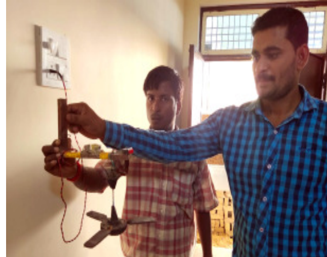
नैनी आईटीसी के छात्रों द्वारा बनाया गया मॉडल।