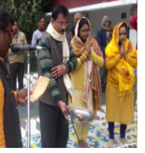
सामग्री भेंट की गई। बच्चों ने मां सरस्वती की प्रतिमा के पास पेन, कापी पुस्तक रखकर पूजन अर्चन किया और मत्था टेक कर विद्या, बुद्धि, ज्ञान के लिए आशीर्वाद मांगा।

लोगों ने माँ सरस्वती को पुष्पांजलि अर्पित कर सबके कल्याण की प्रार्थना की। स्कूल का स्ट्रेज परिसर माँ सरस्वती के स्वागत के लिए सुरुचिपूर्ण ढंग से सजाया