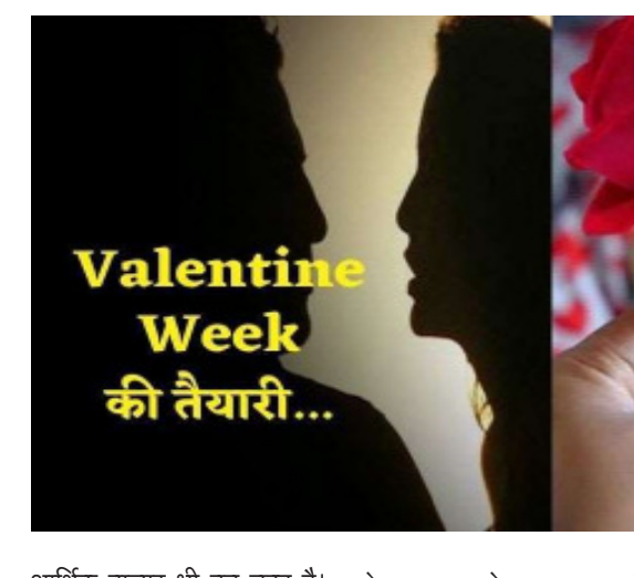
आर्थिक बाजार भी बन चुका है। अब दुकानों पर प्रेमियों की भीड़ कम और आनलाइन कारोबारियों की पाँ बारह अधिक नजर आ रहा है। अमूमन हिंदूवादी संगठनों की सक्रियता की वजह से भी प्रेमी प्रेमिका बेइज्जती के डर से बाहर से होती है। प्रेमियों के बीच अब पकड़े जाने और इंटरनेट मीडिया

हिसाब से फूल और चाकलेट के साथ टेडी बियर भी पैकेज में उपलब्ध है। मांग के अनुरूप इसमें बदलाव और कार्ड को भी जोड़ने का अतिरिक्त चार्ज है। वहीं आर्चीज गैलरी में भी प्रेमी युगलों की खरीदारी शुरू हो चुकी है। यहां भी कार्ड 50 रुपये से लेकर हजार रुपये तक आसानी से उपलब्ध है। आनलाइन का बड़ा बाजार : फर्न्स एंड पेटल्स सरीखे कुछ और भी एप हैं जो प्रेमियों के बीच खासा लोकप्रिय हैं और यहां से अपने प्रेमी या प्रेमिकाओं को तोहफे भेजने पर आपको खुद जाने की जरूरत नहीं पड़ेगी। अपने समवन स्पेशल को तोहफे भेजने के लिए इस प्लेटफार्म पर जाकर दिन के हिसाब से तोहफे चयन करने के बाद एड्रेस और समय तय करना होगा। इसके अनुरूप ही देश भर में इस प्लेटफार्म से जुड़े आउटलेट उसी समय पर तय पर पेमेंट के बाद आईड बुक कर लेंगे। इसके बाद तय दिन और समय पर तोहफे आपके चयनित प्रेमी या प्रेमिका की चौखट पर दस्तक देगा और आप समय से तोहफे भेजें और प्राप्त कर सकते हैं। ऐसे प्लेटफार्म पर फर्क यह नहीं पड़ना कि आपका समवन स्पेशल आपके शहर में है या किसी दूसरे राज्य में।