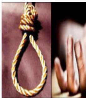
पोटमार्टम के लिए भेजने के साथ ही जांच पड़ताल शुरू कर दी। प्रारंभिक जानकारी के अनुसार युवक की पत्नी विवाद करने के बाद मायके चली गई थी और इसके

बाद वियोग न सह पाने की वजह से पत्नी के वियोग में युवक ने फांसी लगा ली। वहीं फंदे से लटकता शव मिलने के बाद लोगों ने पुलिस को सूचना दी तो मौके पर पहुंची पुलिस ने जांच पड़ताल शुरू कर दी। परिजनों के अनुसार सारनाथ में पत्नी वियोग में रविवार की रात एक युवक ने फांसी लगाकर जान दे दी। वहीं सुबह मामले की जानकारी होने के बाद पुलिस ने शव को कब्जे में ले लिया। पूरी घटना सारनाथ के टंडिया चक बीही पुराना पुल क्षेत्र की है। इस बाबत स्वजन के अनुसार युवक की शादी लगभग एक साल पूर्व ही हुई थी। बीते दिनों किसी बात को लेकर दंपती में आपस में विवाद हुआ था। विवाद के बाद दोनों में अनबन चल रही थी।