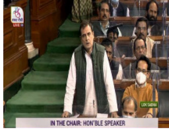
मांग को खारिज कर दिया था। दरअसल राजनीतिक भाषणों में जब

तमाम दलीलों के बाद भारत को राज्यों के संघ के तौर पर स्वीकृत किया गया था। फेडरल स्टेट की