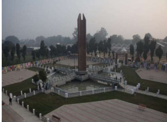
पर समझना है तो जलियांवाला बाग जाना होगा। एक तथाकथित सुसंस्कृत राष्ट्र ने निहत्थे भारतीयों का कटुआम किया। जनाक्रोश राष्ट्रीय हुआ और असहयोग आंदोलन को इसके कारण आधार मिला। चौरी चौरा का आक्रोश जलियांवाला बाग की घटना का प्रत्युत्तर था, परंतु दुर्भाग्यवश घटना ने असहयोग आंदोलन को ही समाप्त कर दिया। विवेचना का प्रशंसा है कि यह दुर्भाग्यवश था या एक सिद्धांत की अवसरवादिता।