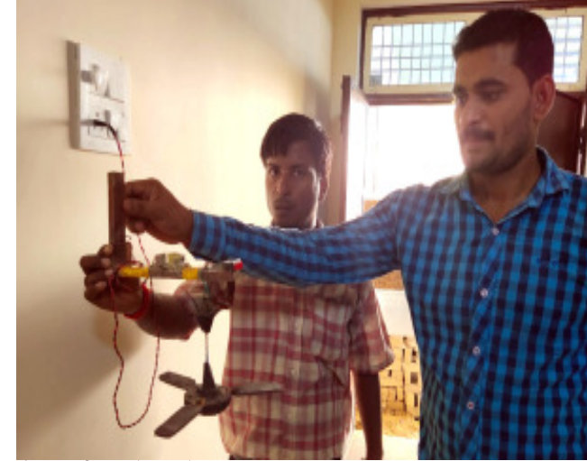
नैनी आईटीसी के छात्रों द्वारा बनाया गया मॉडल।