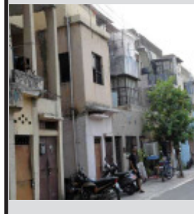
ग्राहकों की समस्या के समाधान को लेकर गंभीर नहीं है। इन्हांसमेंट रिकेकलकुलेशन के बाद प्रदेश के लगभग 25 सेक्टरों की फाइल एचएसवीपी मुख्यालय में पिछले 10 माह से अटकी पड़ी है। एचएसवीपी मुख्यालय द्वारा इन सेक्टरों की राशि अपडेट करने पर अभी कोई निणय नहीं लिया जा