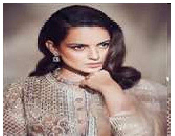
वाली परेशानियों के बारे में बात उनके स्पृमिमेंट्स को बिना किसी

पहवाह के शुरू करें... योग और प्राणायाम को अपनी दिनचर्या में शामिल करें या आपने किसी अन्य प्रकार का व्यायाम करते हैं, तो उसमें ध्यान या प्राणायाम को जरूर जोड़ें...। एक्ट्रेस ने आगे लिखा, आप ये नहीं जान सकते हैं कि आपका शरीर कैसे स्ट्रगल कर रहा है। जब तक कि इसके काम को परिस्थितियों से ना परखा जाए...। अपने पसंदीदा अभिनेता एक पोस्ट को शेयर किया है। इस फोटो को अभिनेता नवाजुद्दीन सिद्दीकी अपने घर के बाहर कुर्सी पर बैठे हुए हैं। इसको शेयर कर अभिनेत्री ने लिखा, नवाजुद्दीन सिद्दीकी सर ने अपना घर खुद डिजाइन किया है। बहुत खूबसूरत है, बहुत-बहुत मुबारकबाद सर। बता दें, कंगना रनोट इन दिनों अपनी पहली प्रोडक्शन फिल्म टूक वेड्स शेरू की आखिरी शेड्यूल की शूटिंग में व्यस्त हैं। इस फिल्म का निर्माण कंगना के प्रोडक्शन हाउस मर्गिकर्णिका फिल्म के बैनर तले किया जा रहा है भी लीड किरदार में आने वाली हैं। सिर