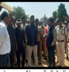
को कुचला मौके पर ही तीनों की मौत का मामला सामने आया है दय मुक्तकों के शवों को पोस्टमार्टम के लिए सामुदायिक स्वास्थ्य केंद्र

जयसिंहनगर लाया गया प्रशासन में मचा ह?कंप उच्च अधिकारियों का अमला जयसिंहनगर में दो दिनों में लगातार दूसरी घटना अब तक 5 लोग हाथियों के झुंडने का शिकार हुए हैं। लगातार लोगों को मुनादी से जोगल मीडिया के माध्यम से