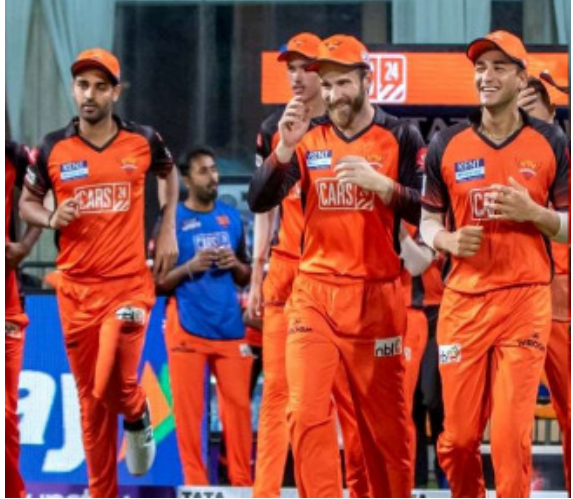
ट्राफी पाने की जंग अब धीरे धीरे और भी रोमांचक हो रही है। चेन्नई और मुंबई को अब भी जीत का इंताजार है और दोनों टीमों अब भी जीत का इंताजार कर रही हैं।

से 6 अंक हैं। सोमवार को हैदराबाद के खिलाफ खेले गए मुकाबले में गुजरात की टीम के पहले हार का सामना करना पड़ा। इसकी वजह से 4 मैच में तीन जीत हासिल करने वाली बैंगलोर की टीम तीसरे स्थान पर पहुंच गई और गुजरात चौथे स्थान पर खिसक गया। कोलकाता के खिलाफ धमाकेदार जीत हासिल करने वाली दिल्ली की टीम छठे स्थान पर है। अब उसके पास 4 मैच में दो जीत और दो हार के साथ 4 अंक हैं। सातवें स्थान पर 4 मैच से 2 जीत और 2 हार से 4 अंक हासिल करने वाली पंजाब की टीम है। गुजरात को हराने वाली हैदराबाद की टीम इस वक्त आठवें स्थान पर काबिज है। उसके पास 4 मैच से 2 जीत और 2 हार से 4 अंक हैं। टूर्नामेंट की सबसे सफल दो टीमों मुंबई और चेन्नई को अब तक अपनी पहली जीत का इंताजार है। दोनों ही टीमों ने चार-चार मैच खेले हैं। सभी मुकाबले में हार की वजह से दोनों टीमों आखिरी के दो पायदान पर हैं। मुंबई 9वें जबकि चेन्नई 10वें स्थान पर है।