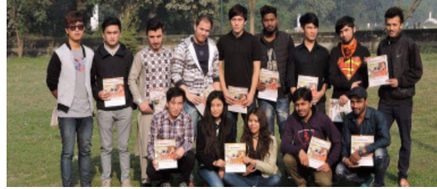
अन्तर्राष्ट्रीय छात्र समूह