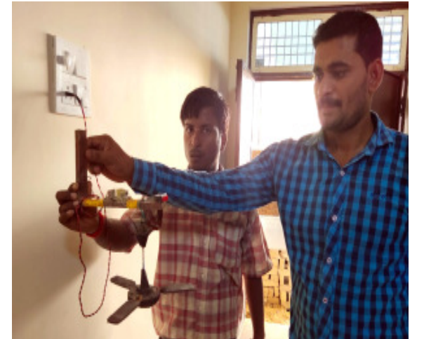
नैनी आईटीसी के छात्रों द्वारा बनाया गया मॉडल।