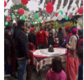
इस दिशा में कुछ करने के लिए प्रेरित होगा। विश्व दिव्यांग दिवस (तीन दिसंबर) को सम्मान समारोह में उन्हें सम्मानित किया जाएगा। कुल 12 श्रेणियों में राज्य पुरस्कार प्रदान किए जाएंगे। इसके लिए संबंधित व्यक्ति या संस्थाओं को जिला दिव्यांगजन सशक्तीकरण कार्यालय में 15 जुलाई