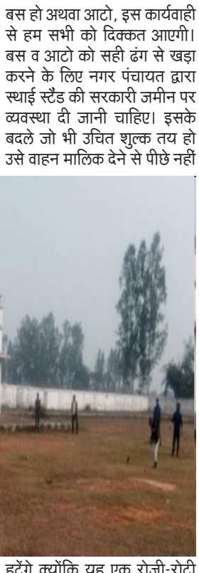
उपजिलाधिकारी दुद्धी सोनभद्र। नगर में अवैध प्राइवेट बस स्टैंड उस तरह का नहीं है। अस्थाई तौर पर बस और आटो वाहन खड़े होते हैं और सवारियों को लेकर चले जाते हैं। बावजूद इसके निजी बसों के ठहराव के लिए जमीन की तलाश शुरू करा दी गई है। बस चालकों को आगाह किया गया है कि वे सार्वजनिक जगहों पर बस खड़ा कर जाम न लगाएं। भारत सोनभद्र, अधिशासी अधिकारी दुद्धी सोनभद्र। सरकार ने अवैध बस स्टैंड को हटाने का निर्देश दिया है। निजी

हटेंगे क्योंकि यह एक रोजी-रोटी है। सवारी जीप चलाकर परिवार का भरण पोषण करते हैं। सरकार के इस आदेश से यदि बसों अथवा आटो का संचालन प्रभावित होता है, तो हम चालकों की रोजी रोटी में दिक्कत होगी। कहीं तो स्टैंड स्थापित होना चाहिए ताकि वहां से सवारी एकत्रित होकर अपने गंतव्य के लिए सुविधा पूर्ण तरीके से आटो में सवार होकर अपने गंतव्य तक पहुंच सकें, और हम चालकों को भी रोजी रोटी का सहारा बना रहे।