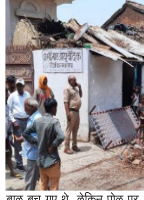
बाल बच गए थे, लेकिन पोल पर टक्कर लगने के कारण हाईवोल्टेज तार नीचे की तरफ लटक रहा है। इसके चलते ग्रामीण मौत के साप में जीने को विवश हैं। ग्रामीणों का कहना है कि कई बार विभागीय अधिकारियों और कर्मियों से गुहार लगाई, लेकिन आश्वासन ही मिलता रहा। ग्रामीणों का आरोप है कि सूचना पर पहुंचे विद्युत विभाग के

कमियों ने बिना न पोल लगाए ही 33000 वोल्टेज के तार को जोड़कर बिजली आपूर्ति बहाल कर दी। इसके बाद भी तार पोल से काफी नीचे हैं। एक सप्ताह बाद भी विद्युत कमियों के अडियल रवैए के चलते ग्रामीण परेशान हैं। इस