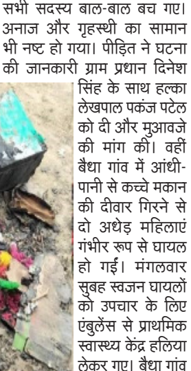
आंधी-तूफान के दौरान मलबे में दबने से घायल लोगों को उपचार के लिए एंबुलेंस से प्राथमिक स्वास्थ्य केंद्र हलिया लेकर गए।