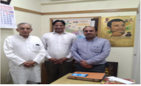
मिलकर संघर्ष करना होगा भाजपा