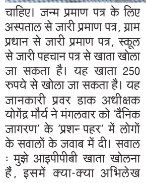
आजमगढ़। सुकन्या समृद्धि योजना से बेटियों का भविष्य समृद्ध होगा। खाता खोलने के लिए बेटों का जन्म प्रमाण पत्र और माता या पिता का आधार कार्ड, पैन कार्ड की स्वप्रमाणित छाया प्रति देनी होगी।