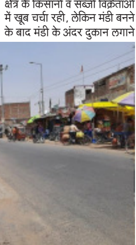
किसानों व सब्जी विक्रेताओं में खूब चर्चा रही, लेकिन मंडी बनने के बाद मंडी के अंदर दुकान लगाने की प्रक्रिया प्रशासन द्वारा पूर्ण नहीं कराई गई।

पड़री (मीरजापुर)। पहाड़ी विकास खंड के ग्राम पंचायत टौगा में दाहीराम मार्ग पर लाखों की लागत के किसानों व सब्जी विक्रेताओं में खूब चर्चा रही, लेकिन मंडी बनने के बाद मंडी के अंदर दुकान लगाने की प्रक्रिया प्रशासन द्वारा पूर्ण नहीं कराई गई। इससे किसान व सब्जी विक्रेता कई वर्षों से सड़कों पर व ठेकेदारों की जमीनों पर मोटी रकम देकर सब्जी की दुकान लगाते हैं। उधर ठेकेदारों की वजह से वाराणसी-मीरजापुर मार्ग न केवल सिकुड़ती जा रही है, बल्कि इससे आवागमन में परेशानी होने लगी है, जाम की समस्या भी बढ़ती जा रही है।