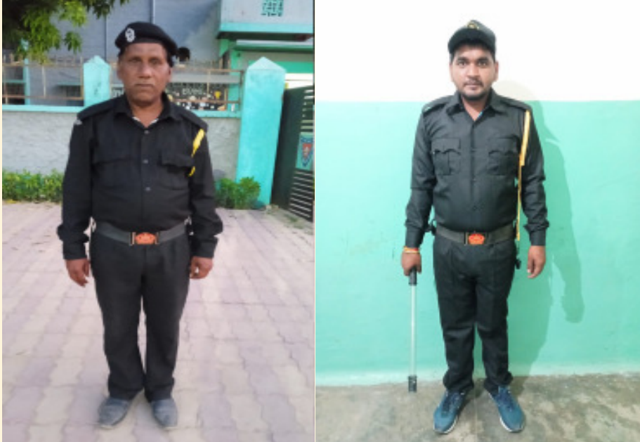
सूझबूझ से परिचय देने वाले सुरक्षाकर्मि

वो सभी भाग खड़े हुए। जिससे विद्यालय में बड़ा हादसा होते-होते टला गया स्कूल प्रबंधन द्वारा सुरक्षा कर्मियों की प्रशंसा की गई और उनके इस प्रयास के लिए उन्हें बधाई दी गई है।