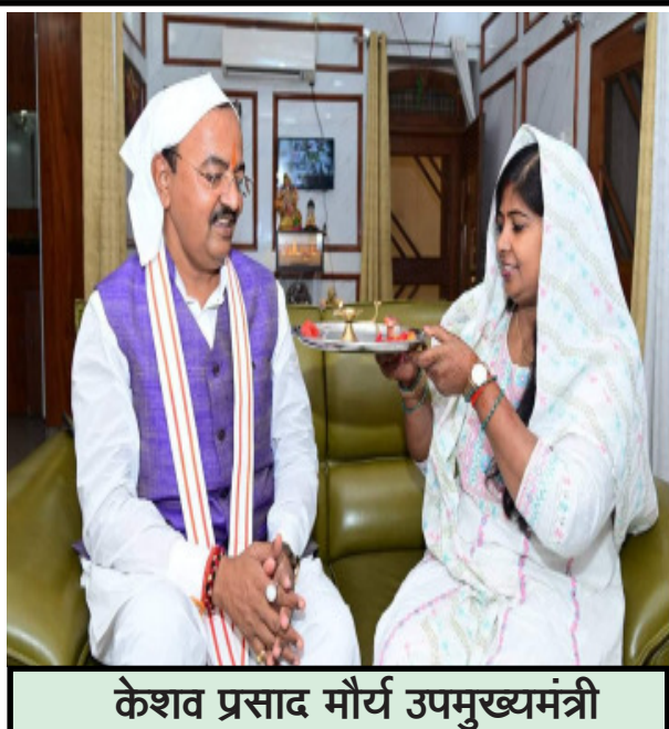
केशव प्रसाद मौर्य उपमुख्यमंत्री