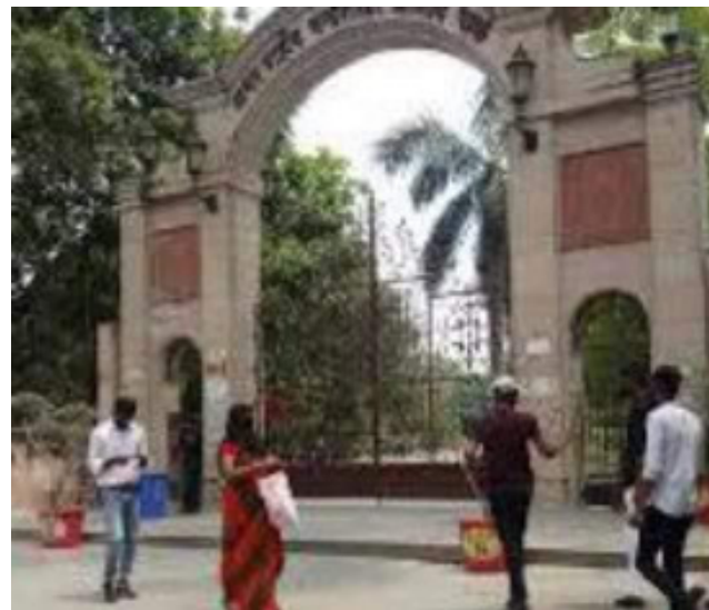
इसके बाद इरम की खोजबीन शुरू हुई। कुछ लोग कंपनीबाग में स्थित मजार के पास पहुंचे जहां उसकी खून से लथपथ लाश देख हतप्रभ रह गए।

आधुनिक समाचार सेवा प्रयागराज। चंद्रशेखरजार्क स्थित मजार के पास शनिवार दोपहर 32 वर्षीय महिला के सर पर वार कर हत्या कर दी गई। महिला अपने बच्चे को स्टेड जोजफ स्कूल कूल से लेने गयी थी। स्कूल छूटने के कोलाहल के बीच कल किसने और क्यों किया, यह अभी साफ नहीं हो सका है।