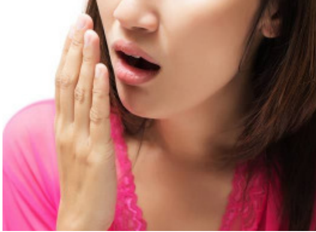
कमी होने से दांतों में कई तरह की समस्या होने की संभावना हो सकती है।

नीम के दातून से अपने दांतों को जरूर साफ करें। पुदीना दूर करेगा दुर्गंध: आप अपने मुंह से आने वाली दुर्गंध की समस्या से परेशान हैं तो ऐसे में पुदीना चबाना काफी मददगार साबित हो सकता है। इसे अपनाने से आपके मुंह से बदबू आनी बंद हो जाएगी। खाने के बाद सौंफ: मुंह से बदबू आने कारण कई बार हमारे द्वारा सेवन किया गया भविष्य में आपके दांतों के लहसुन, प्याज, मांस-मछली का सेवन करने पर भी ये समस्या होना आम बात है। ऐसे में जरूरी है कि आप खाना खाने के बाद सौंफ जरूर खाएं। इसका सेवन करने पर आपकी सांसों से दुर्गंध नहीं आएगी। सही ढंग से करें ब्रश: सही तौर पर ब्रश करने की बात आप अपने घर में बच्चों को सीखाते होंगे, लेकिन हम में से भी कुछ ऐसे लोग होते हैं जो गलत तरह से ब्रश करते हैं। बता दें कि सही ढंग से ब्रश करने का मतलब ये होता है कि आपको अपने दांतों को कुछ समय तक अच्छे से ब्रश को घुमाना चाहिए। ऐसे में जल्दबाजी करना, भविष्य में आपके दांतों के लिए ही समस्या खड़ी कर सकते हैं। ब्रश करने के दौरान मसूड़ों का खास ध्यान रखें। ब्रश करने के बाद माउथ फ्रेशनर का प्रयोग जरूर करें। ऐसा करने से आपके मुंह से आने वाली बदबू को खत्म किया जा सकता है।