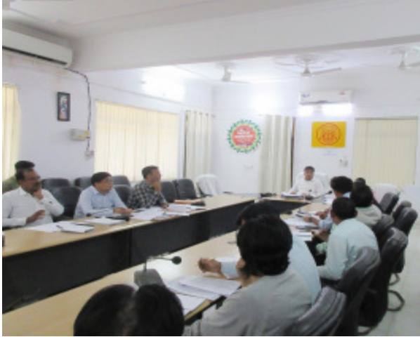
सम्बन्धित किसी विभाग की यदि कोई समस्या हो तो उसे आपसी समन्वय स्थापित करते हुये उसका निराकरण कराये, पेयजल से जुड़ी

(आधुनिक समाचार सेवा) प्रतापगढ़। जिलाधिकारी डा० नितिन बंसल की अध्यक्षता में कौम्य कार्यलय के सभागार में जल जीवन मिशन के अन्तर्गत ग्रामीण पाइप पेयजल योजनाओं के निर्माण कार्यों एवं डीपीआर0 स्वीकृति के सम्बन्ध समीक्षा की गयी। बैठक में जल जीवन मिशन की परियोजनाओं की समीक्षा की गई एवं कार्यदायी संस्था को कड़े निर्देश दिये कि कार्यों में और तेजी लायी जाये। जिलाधिकारी ने जनपद में जल जीवन मिशन का कार्य शत प्रतिशत समय से पूर्ण कराने के निर्देश देते हुये कहा कि यह सरकार की महत्वाकांक्षी योजना है इसमें किसी भी प्रकार की लापरवाही न की जाये, साथ ही सभी कार्यदायी संस्थाओं को सख्त निर्देश देते हुये कहा कि सभी परियोजनाओं के कार्यों की धीमी प्रगति पर जिलाधिकारी ने नाराजगी व्यक्त करते हुये जेएमसी के प्रोजेक्ट मैनेजर को नोटिस जारी करने का निर्देश दिया और कहा कि परियोजनाओं के कार्यों की प्रगति बढ़ाये इसमें किसी भी स्तर पर लापरवाही न बरती जाये। जिलाधिकारी ने निर्देशित किया कि निर्माणधीन पेयजल परियोजना से