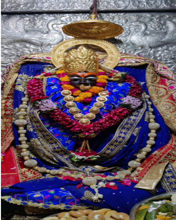
वाले साधक का मन सहस्रार चक्र में स्थित होता है। इनकी पूजा में गुड़ के भोग का विशेष महत्व है। मां कालरात्रि स्वरूप की पूजा, अर्चना और स्तवन निमन मंत्र से

किया जाता है जपाकर्ण,पूरा नगन खरास्थिता। लम्बोष्ठी कर्णिकाकर्णी,तैलाभ्यक्तशरीरिणी। जपाकर्ण,पूरा नगन खरास्थिता।