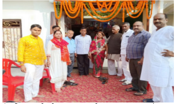
रोड निकट कालीबाड़ी राजरूपपुर प्रयागराज ओम शिव फोटो स्टेट

स्टेशनरी एवं गिफ्ट शॉप की शॉप का उद्घाटन तीनों बेटों ने अपने मां-बाप से