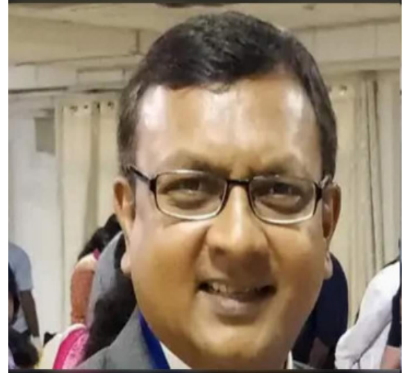
एसोसिएशन सर्जन ऑफ इंडिया का राष्ट्रीय अध्यक्ष चुना गया है। एसएसआई के 84 साल के इतिहास में इस पद पर चुने जाने वाले प्रयागराज के पहले सर्जन हैं। उत्तर प्रदेश से इससे पहले मात्र 6 सर्जन इस कुर्सी तक पहुंचने में सफल रहे हैं। अध्यक्षीय पद के लिए वोटिंग 1 अक्टूबर से शुरू हुई थी जो 31 अक्टूबर तक चली। उन्होंने

ऑनलाइन वोटिंग में एकतरफा मुकाबले में तेलगाना के डॉ. सोआरके प्रसाद के 1135 मतां के मुकाबले 5114 मत प्राप्त कर भारी की पढ़ाई एफएमसी पुणे से की थी। उसके बाद मोतीलाल नेहरू मेडिकल कॉलेज से सर्जरी में पोस्ट ग्रेजुएशन किया और पोस्ट ग्रेजुएशन करने के बाद डॉ. नियोगी ने इंग्लैंड से एफआरसीएस की डिग्री प्राप्त की। उसके बाद मोतीलाल नेहरू मेडिकल कॉलेज के सर्जरी विभाग में प्रोफेसर के रूप में नियुक्त हुए। इस उपलब्धि के लिए इलाहाबाद सर्जन एसोसिएशन के पदाधिकारियों ने खुशी जाहिर की है। यूके में एक आरामदायक नौकरी के बावजूद, वह अपने बड़े माता-पिता के साथ रहने के लिए 2000 में भारत लौट आए। 2002 में वह एमएलएन मेडिकल कॉलेज में लेक्चरर के रूप में शामिल हो गए, जहाँ वह अभी भी सर्जरी के प्रोफेसर के रूप में काम कर रहे हैं। उन्होंने अब तक 20,000 से अधिक सर्जरी किए हैं। उन्होंने 30 से अधिक शोधों का मार्गदर्शन किया है। राष्ट्रीय और अंतरराष्ट्रीय दोनों जर्नलों में उनके कई लेख व रिसर्च पेपर छपे हैं। अध्यक्ष का पद संभालने से पहले, वह पिछले 20 वर्षों में सिटी ब्रांच से लेकर स्टेट चैंपियन और फिर नेशनल बोर्ड तक सभी स्तरों पर एसोसिएशन सर्जन ऑफ इंडिया (एसएसआई) की सेवा कर चुके हैं। वर्तमान में, वह एसएसआई के उत्तर प्रदेश अध्याय के उपाध्यक्ष/राष्ट्रपति चुनाव 2022 के पद पर थे।