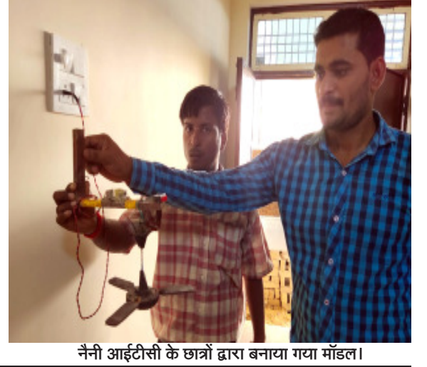
नैनी आईटीसी के छात्रों द्वारा बनाया गया मॉडल।