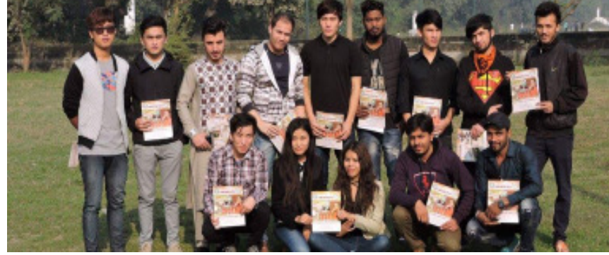
अन्तर्राष्ट्रीय छात्र समूह