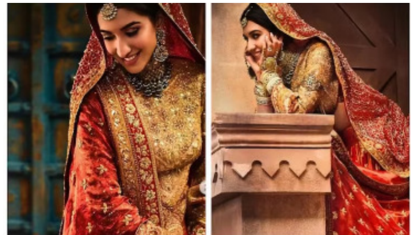
की विदाई की तस्वीरों की सीरीज को राधिका ने मनीष मल्होत्रा द्वारा रिया कपूर ने राधिका के लुक को

की मालिक किम शुक्लार सुबह भारत पहुंची और ताज महल होटल में उनका बहुत धूमधाम से स्वागत किया गया। मुंबई के ताज महल होटल के स्टाफ ने किम का माला पहनाकर और माथे पर टीका लगाकर स्वागत किया।