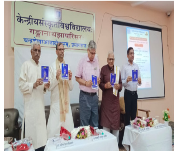
त्रिकोण भूमि टापू बीच में बनाती थी। गुरुओं ऋषियों के कारण इस स्थान का प्रथम नाम तीर्थराज था। जीवन जीने की कला खेती विकसित होने के कारण यहां अनेक यज्ञ हुए और बाद में इसका नाम प्रयाग हुआ। प्रयागराज के वैदिक एवं पौराणिक तीर्थ और माधव पर आयोजित गोष्ठी

(आधुनिक समाचार नेटवर्क) प्रयागराज। तीर्थराज प्रयागराज विश्व में अद्भुत भौगोलिक संरचना थी। जहां तीन तरफ नदिया मिलकर एक