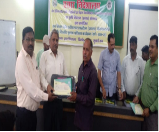
प्रयोजित सब मिशन ऑन एग्रीकचर एक्सटेंशन (आत्मा) योजनाअर्गत पांच सभागार, प्रसार निदेशालय में सम्पन्न हुआ। निदेशक प्रसार शुआट्स डा०