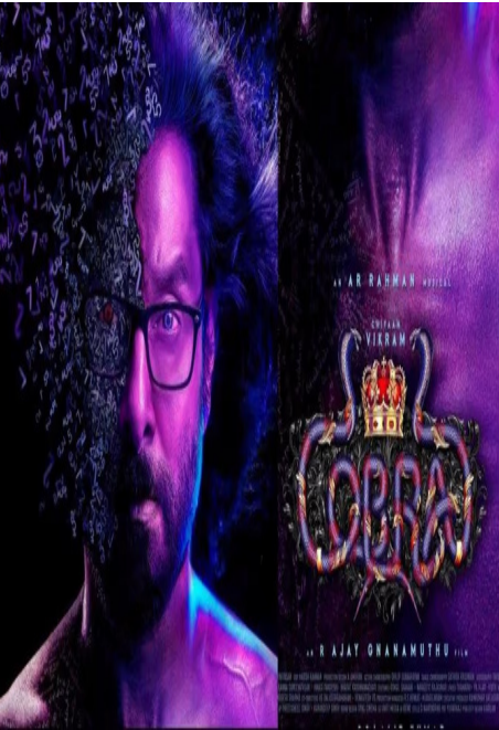
26 लाख का बिजनेस हुआ है। नजर आएंगे।

वहीं इसके पहले दिन के कलेक्शन की बात की जाए तो तामिलनाडु में कोबरा 15 करोड़ की ओपनिंग कर सकती है। गौरतलब है कि कोबरा फिल्म में विक्रम एक बार फिर दमदार भूमिका में नजर आने वाले हैं। हाल ही में इस फिल्म का ट्रेलर रिलीज किया गया था जिसे दर्शकों ने काफी पसंद किया था। ट्रेलर में विक्रम का अलग ही अंदाज देखने को मिला था। जानकारी के मुताबिक इस फिल्म में विक्रम को 25 अलग-अलग रूप में नजर आने वाले हैं। फिल्म में उनके अलावा श्रीनिधि शेठी मुख्य भूमिका में हैं। इस फिल्म से पूर्व क्रिकेटर इरफान पठान अपना डेब्यू करने जा रहे हैं। इसके अलावा, मिया जॉर्ज, रोशन मैथ्यू, सरजानो खालिद, पद्मप्रिया, मोहम्मद अली बेग, कनिहा, मिरनालिनी रवि, मीनाक्षी और के.एस. रविकुमार भी फिल्म में सहायक भूमिकाओं में नजर आएंगे।