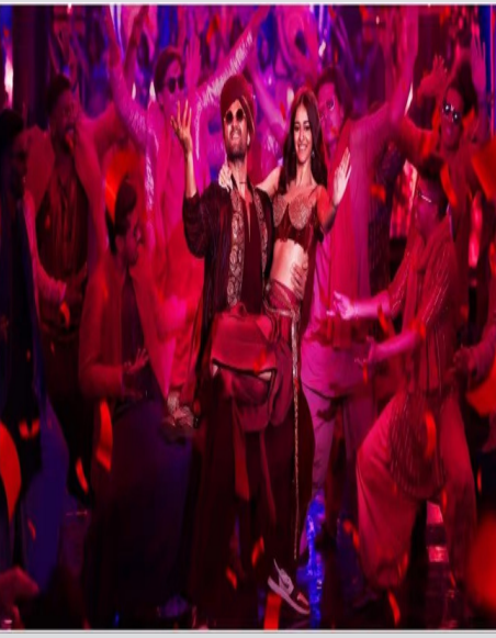
रूपये की लागत से बनाया गया है। इसके हिसाब से अगर कलेक्शन देखा जाए तो बजट निकलना भी मुश्किल होता दिख रहा है। फिल्म में विजय देवरकोंडा ने एक बॉक्सर की भूमिका निभाई है। वहीं अनन्या पांडे संग अभिनेता की बनी है जबकि बाहुबली में शिवगामी देवी के दमदार किरदार में अपनी अलग छाप छोड़ने वाली दिग्गज अभिनेत्री रायचा कुषान विजय की मां की भूमिका में है।

फिल्म लाइगर ने जिस तरह से 16 करोड़ की शानदार ओपनिंग की थी, उसे देखकर उम्मीद की जा रही थी कि फिल्म अच्छी कमाई करेगी, लेकिन फिल्म देखने के बाद दर्शकों की खराब प्रतिक्रिया का असर फिल्म की कमाई पर पड़ता दिखाई दे रहा है। फिल्म लाइगर ने पहले दिन 16 करोड़ की कमाई की लेकिन दूसरे ही दिन फिल्म की कमाई में गिरावट दर्ज की गई और इसने सिर्फ 7.70 करोड़ का कलेक्शन किया जो आधे से भी कम रहा। इसके बाद वीकेंड पर शनिवार और रविवार को भी लाइगर दर्शकों को आकर्षित नहीं कर पाई, जहां तीसरे दिन फिल्म