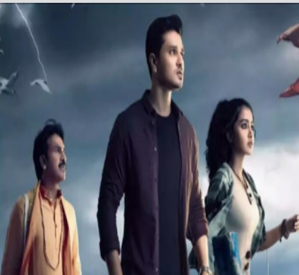
माधवन की ठरकैट्टी: द नाबी इफेक्ट को पीछे छोड़ दिया जो एक हिंदी-तमिल द्विभाषी फिल्म थी। बता दें कि इस लिस्ट में पहले नंबर पर एसएस राजामौली की ब्लॉकबस्टर फिल्म 'बाहुबली 2' है जिसने बॉक्स ऑफिस पर 510 करोड़ की कमाई की थी। वहीं दूसरे नंबर पर यश स्टारर केजीएफ चैप्टर 2 है। जिसने