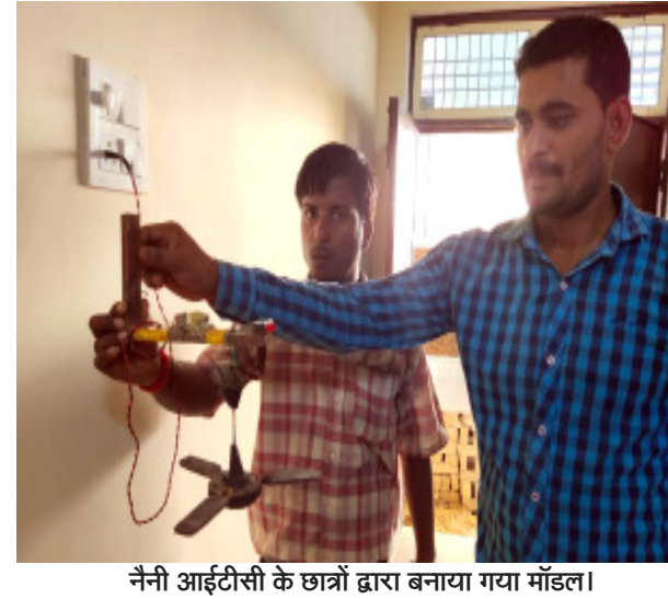
नैनी आईटीसी के छात्रों द्वारा बनाया गया मॉडल।