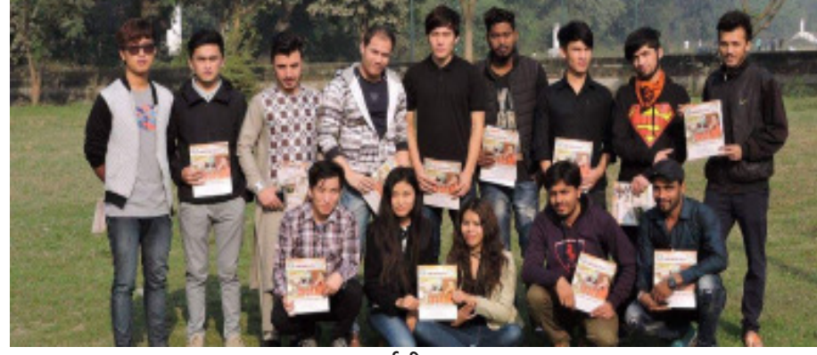
अन्तर्राष्ट्रीय छात्र समूह