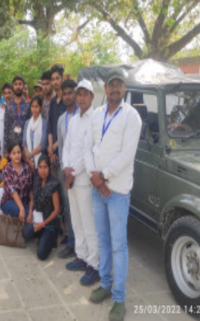
युवाओं को नैतिक दायित्वों का निर्वहन