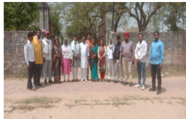
चौकी प्रभारी पर मारपीट का आरोप

हरहुआ (वाराणसी)। पुलिस अधीक्षक वाराणसी ग्रामीण के यहां शुकुवार को व्यापारियों का एक प्रतिनिधिमंडल ने मिलकर चौकी प्रभारी खजुरी राजतालाब के व्यापारी के साथ दुर्व्यवहार मारपीट के मामले में