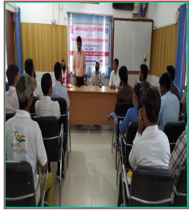
युवाओं को नैतिक दायित्वों का निर्वहन