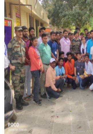
युवाओं को नैतिक दायित्वों का निर्वहन

के नाम से नामित कर वाराणसी, प्रयागराज व कानपुर में पायलट प्रयोग किया जा रहा है। यह टास्क फोर्स मुख्य रूप से गंगा किनारे पैथरोपण व गंगा की स्वच्छता पर जनमानस को जाइते हुए कार्य कर रही है।